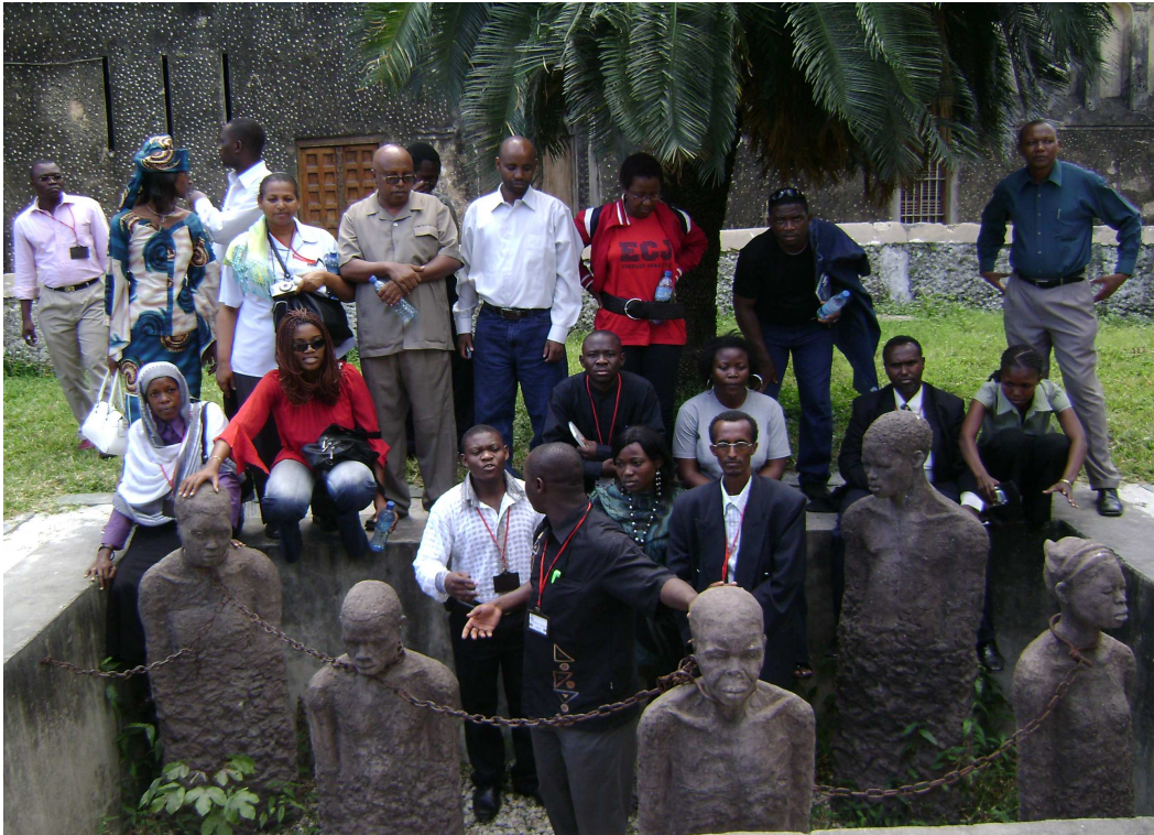
(waa halkii lagu xidhi jiray dadka lagu kala iibsano suuqa addoonta ee Zanzibar)

Dhulkan Afrikada bari ee xeebaha badweynta Hindiya ee Sansibaar hormoodka u tahay, addoonta waxa markii hore loo adeegsanayey inay guraan fool maroodiga oo ahaa badeecad aad looga jecel yahay ilaa shiinaha. Laakiin qarnigii 18aad ayuu aad kor ugu kacay suuqa addoontu oo sannadkii 1750 ilaa 3000 oo qof baa la dhoofiyey.