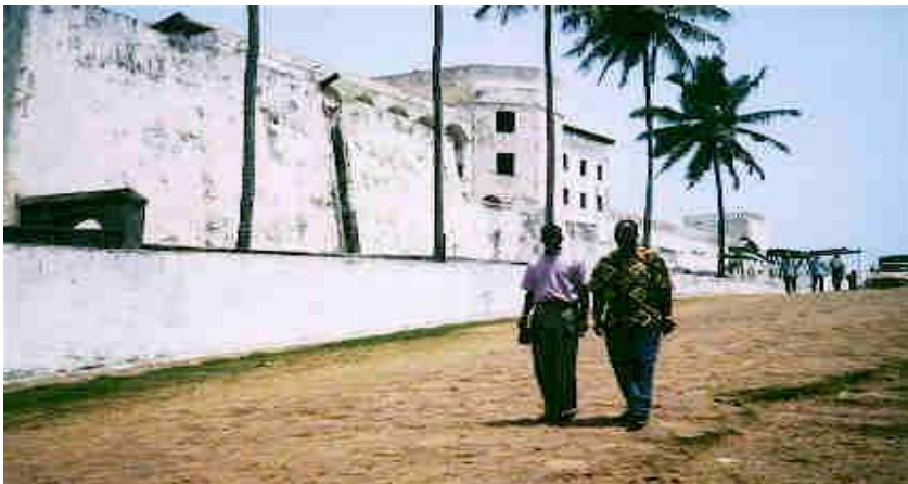
(muuqaalka Elmina Castle)

Dadka madow ee dhismahan Elmina Castle soo booqdaa waxay ka siman yihiin oohin iyo xusuus murugo huwan inkastoo aan la garanayn inta xusuustaasi qalbigooda ku sii jiri doonto, waxa ay u kordhin karto iyo waxa ay ka korodhsan karaan.